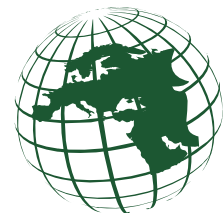
EUROPA / MEDIO ORIENTE EUROPA / MIDDLE EAST

A model that has gradually expanded, finding business market opportunities even in the Middle East, Africa and Asia. All this effort in order to create a real interface with the end-user, entrusted to highly experienced professionals, able to guarantee a value that is essential for us: the support before, during and after the purchase of our products.